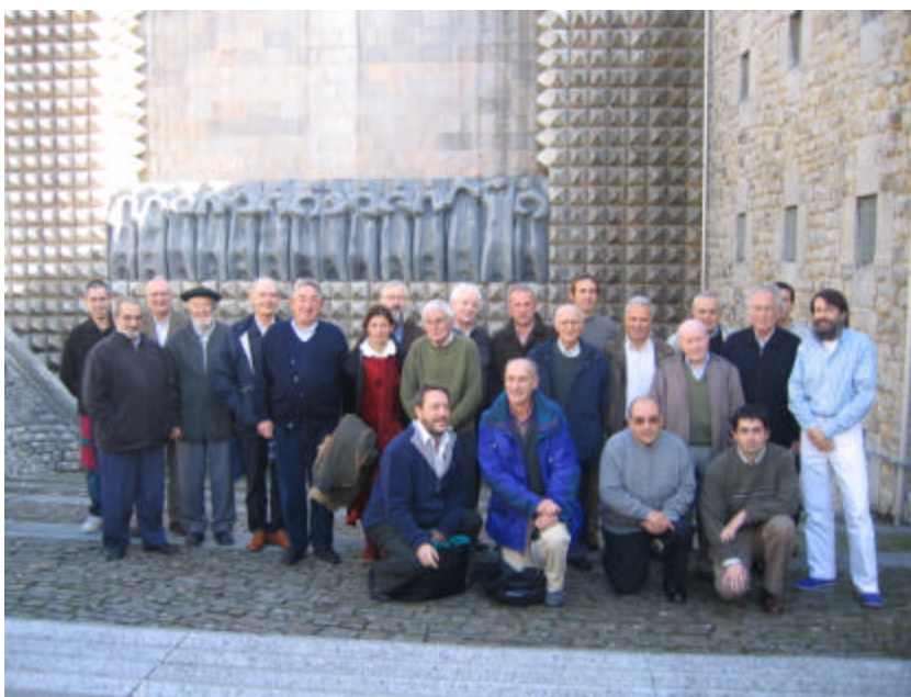
Euskararen Jatorriaren I. Biltzarraren hizlariak eta zenbait partaide. Arantzazu, 05.11.19