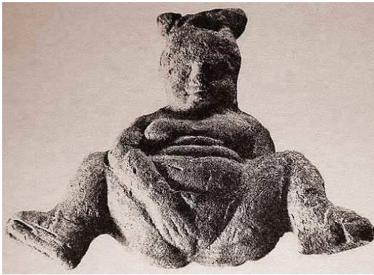
Baubo griega. Misterios eleusinos