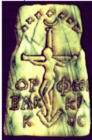
Orfeo Bakki crucificado