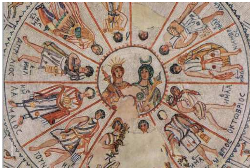
Mosaico en el yacimiento de Tell Beit She'an (Turquía)

Como curiosidad, traer a colación que en el yacimiento de Tell Beit She'an (actual Turquía) en el contexto del monasterio bizantino de Nuestra Señora María, se encontró un mosaico del siglo III con las figuras deificadas del Sol y la Luna, rodeados por un calendario de diseño hebreo, que se ha interpretado como la representación de Jesús Sol Invictus y María Magdalena como sacerdotisa de Artemisa o bien el Espíritu-Sofía, muy propio de la iconografía gnóstica.