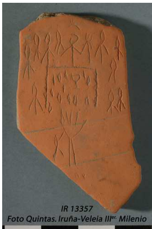
Última cena. Iruña-Veleia IR 13357

La compañera del Salvador es María Magdalena. Pero Cristo la amaba más que a todos los discípulos, y solía besarla a menudo en la boca. El resto de los discípulos se sentía ofendido... Le decían '¿Por qué la amas más que a todos nosotros?' El Salvador contestó diciéndoles: '¿Por qué no os quiero como la quiero a ella?'