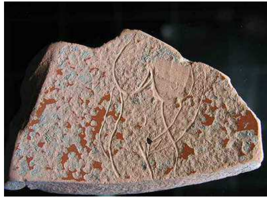
La llamada "venus" de Veleia