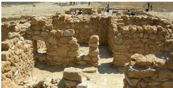
Ruinas esenias de Qumram, 134 a.C.

Refiriéndome al cristianismo, que es lo que nos ocupa, tengo que decir que su origen judío se remonta hasta una secta llamada de "los terapeutas" y otra más conocida como los "esenios". Los primeros fueron más contemplativos y grandes conocedores de las plantas curativas; los segundos, más intelectuales y moralistas. Ambas provienen, a su vez, de un sincretismo entre judaísmo y paganismo en gran parte pitagórico. Con el imperio de Alejandro Magno las culturas del Mediterráneo adoptaron el griego como lengua vehicular, la koiné , que significa común u oficial. Eso hizo que el gnosticismo se expandiera exponencialmente, ya que los gnósticos paganos, judíos y cristianos escribían en griego.