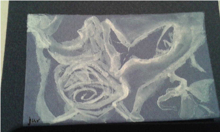
Izenburua: Mariren kabia