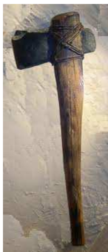
(Irudia: Uxio Noceda)

Kasu honetan, hizkuntza guztietan agertzen den erroa, ATX, bere aldagai guztiekin (ach, ax, adz, az...), gizakiak sortutako lehenengo aizkora izango litzateke, etimologia ezin argiago batekin.