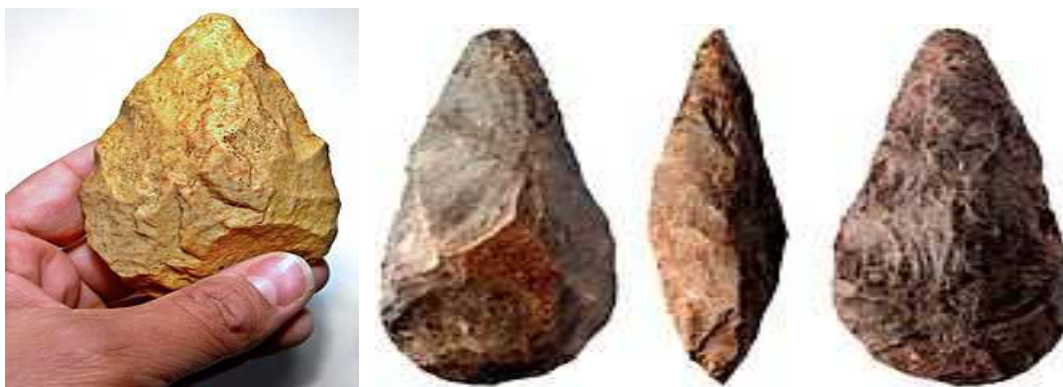
“aitzez” egindako bi aurpegietaiko aizkoren irudiak

Beraz, aiztoak arroka mota bat den sukarriz egiten ziren. Ikus dezagun orain aizkora mota bati buruz (bifaz), gaztelerazko Wikipedian zer dagoen: