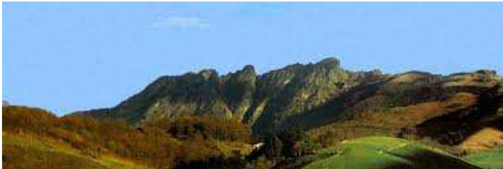
Aiako Harriak