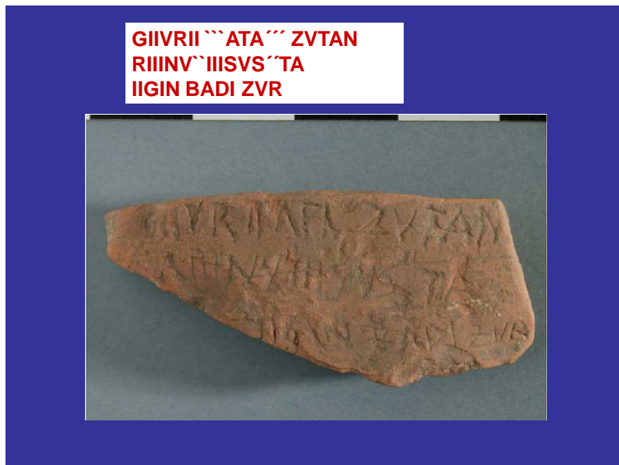
Graffiti de Iruña-Veleia - "Nuestra ""Puerta"" ardiendo (primera línea) La Puerta Sagrada y el Fuego