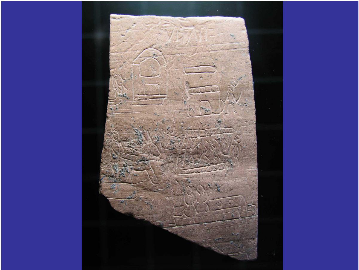
Graffiti de Iruña-Veleia - Vitae - Una persona en actitud reverencial de rezo ante la Puerta Sagrada. (esquina superior izda).