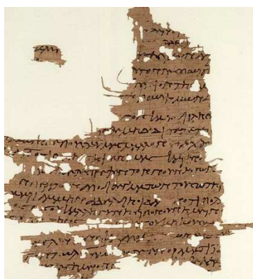
Evangelio de María Magdalena (Codex Berolinensis, hallado en 1896, ver nota 54)

"En su vehemente deseo de dilatar los dominios de la fe ciega, los primeros teólogos cristianos (de la iglesia romana) ocultaron tanto como les fue posible las fuentes de su ciencia, y al efecto se dice que entregaron a las llamas cuantos tratados de cábala, magia y ocultismo hallaban a mano, creyendo equivocadamente que con los últimos gnósticos habían desaparecido los manuscritos más peligrosos de esta índole" (Helena Blavatsky, Isis sin Velo, Vol. III, 31).