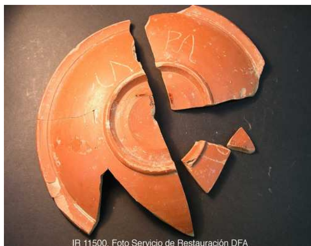
IR 11500.