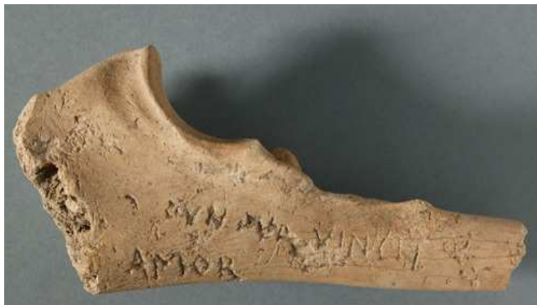
OMNIA VINCIT AMOR (con presencia de dislexia).