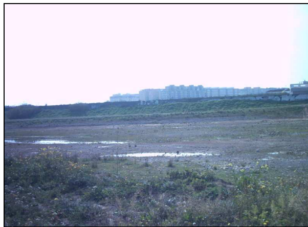
Palancia erreka uda garaian, Sagunto ondoan

Seguruenik orain dela sei edo zortzi mila urte, urak erregulatzeko presa, urtegi edo antzekorik ez zegoenean, Ebro definitzeko egon zitekeen izenik zehatzanetakoa zen. Batez ere Frantziatik ia Portugaleraino errekek baino ez ditugunean (urte osoan urik ez dutenak): Muga, Fluvià, Besos, Tordera, Foix, Llobregat, Sec, Palentzia, Turia, Xúquer, Serpis, Jalon, Riusec, Algar, Segura, Almanzora, Andarax, Adra, Guadalmedina, Guadalhorce, Guadaljaro, Hozgarganta (guzti hoiek erromatarren aurreko izenak, euskaldunak ez esateagaitik...), eta dozenaka erreka txikiago.